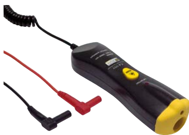
Berührungsloser Drehzahl-Sensor CA 1711 für Drehzahlmessungen (von 6 bis 120.000 min -1 )